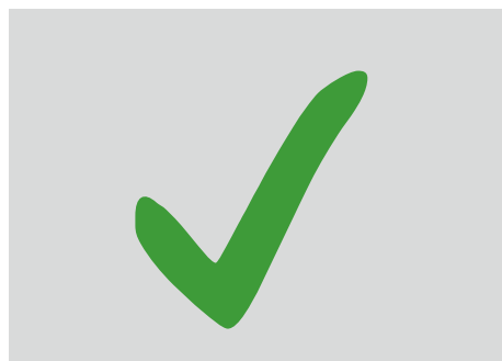
Umlaufend 3 mm Beschnitt, bitte Sicherheitsabstand für Besatzband und Saum von mind. 2,5 cm beachten.